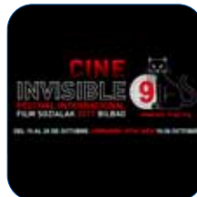
ZINEMA IKUSEZINA (JAIALDIA)